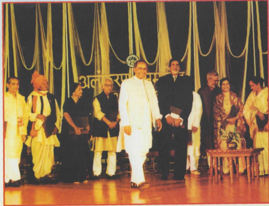
मध्य प्रदेश शासन द्वारा तुलसी सम्मान समारोह का एक दृश्य